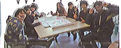
▲私選があるぷあタウン実行委員です！